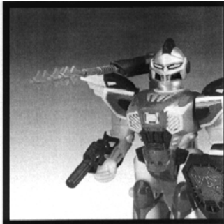
Из пусковой установки вылетает снаряд

Вам потребуются 2 батарейки размера «AA» 1,5V