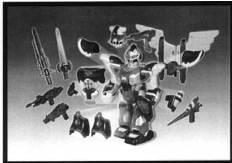
Съемные детали и аксессуары