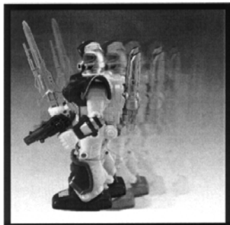
Во время ходьбы голова и руки робота двигаются, робот издает звуковые и световые сигналы

Внимание: Игрушка не предназначена для детей младше 3 лет! Содержит мелкие детали!